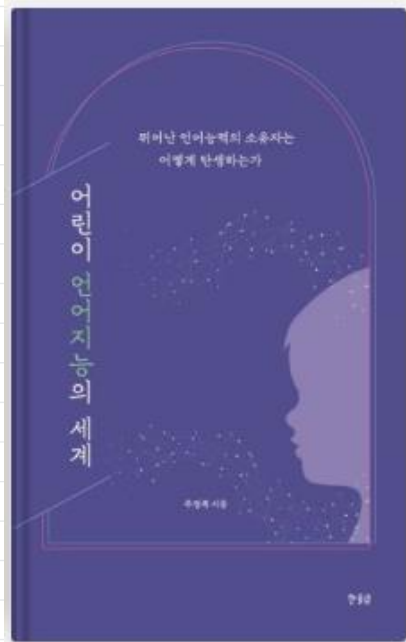
어린이 언어지능의 세계